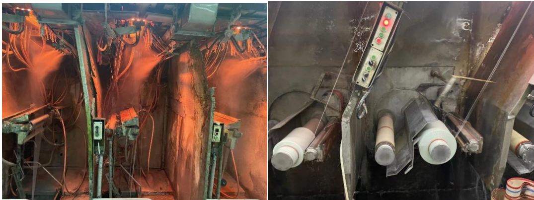
图 2-5 拉丝成型工段

浸润剂输送和循环由大小二个循环系统组成。配制好的浸润剂由贮罐输入循环罐，当循环罐浸润剂超过规定量时，由液面控制仪启动电磁阀由循环罐返回贮罐，此为大循环。小循环为循环罐输送浸润剂至单丝涂油器，涂油器内多余的浸润剂经过滤返回循环罐。由液面控制仪、电磁阀、乳液泵组成的本系统实行自动控制，以保证单丝涂油器中浸润剂流量的稳定。为了改善原丝卷绕性能和让原丝满足后道工序加工特性要求，在漏板下方还设有单丝涂油器。单丝涂油器采用石墨辊式，单丝经石墨辊表面时，涂上增强型浸润剂，再经分束器或集束器后，供拉丝机卷绕。整个浸润剂系统的贮存、输送及大、小循环均实行制冷恒温控制，使配制的浸润剂温度四季恒定。