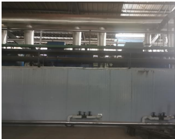
图 2-7 烘干工段

本项目采用烘干炉进行烘干，采用池窑废气处理系统余热锅炉产生的蒸汽作为热源（余热不足时候，通过天然气燃烧产生热源），烘干温度为 40~50℃，烘干时间 30min，烘干后的原丝进入下一工序。烘干炉设置有微波装置，以提高生产效率。