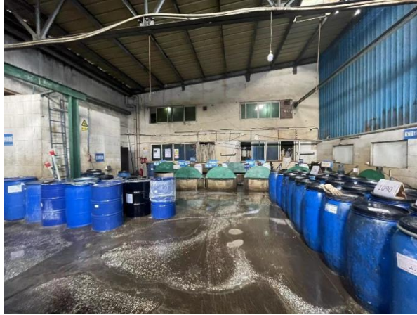
图 2-6 浸润剂配制工段

各类浸润剂制备原料（冰醋酸、有机硅、环氧聚乳液、表面活性剂、氯化铵）按照一定比例人工加入浸润剂配制罐中，通入预混罐混合后，通过管道输送至玻璃纤维成型工序待用。配制罐封闭，设置管道将配制过程有机废气引至两级活性炭吸附装置处理后排放。