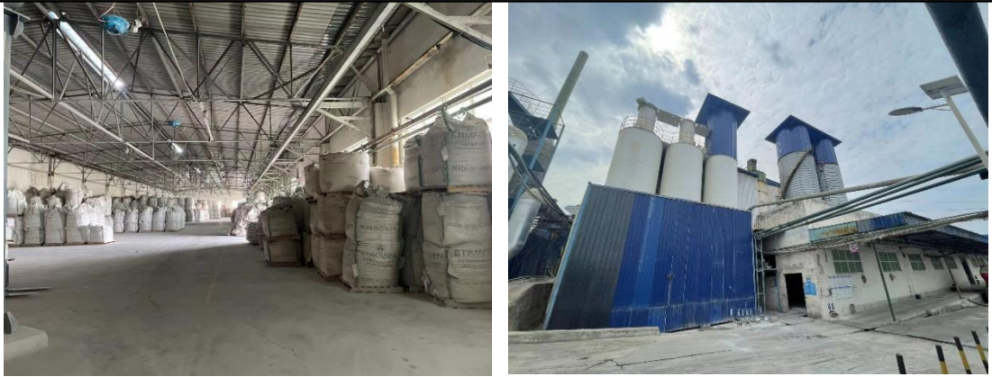
图 2-3 袋装原料储存区和立式储仓

项目采用密闭的气力输送和气力混合方式，整个配料工序由气力输送上料系统、电子称量系统和气力混合、输送系统三个部分组成。