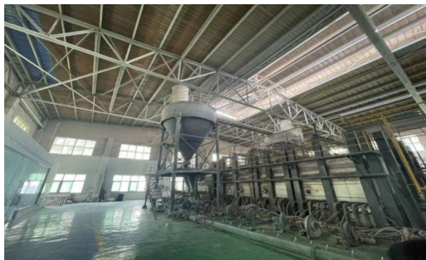
图 2-4 窑头料仓及池窑

池窑烟气主要为颗粒物、氮氧化物、SO 2 。其中氮氧化物为热力燃烧产生；SO 2 产生于高岭土中硫酸盐分解。池窑进入池窑废气处理系统处理，处理后的废气由 40m 高的排气口排放。